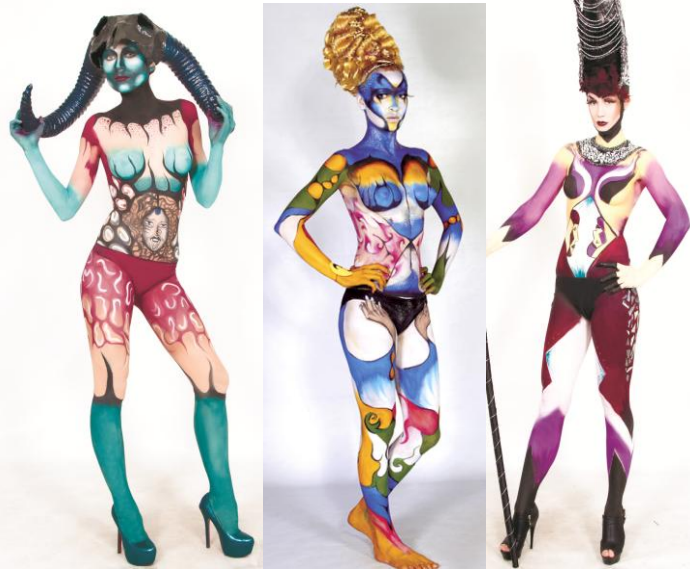
Фото работ с шоу-программ прошлых Фестивалей «Хрустальный Ангел»

ВНИМАНИЕ! Все правила, указанные в Положении о Чемпионате «Fantasy Style» являются неотъемлемой частью условий конкурса боди-арта!