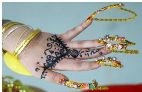
Фото конкурсных работ с прошлых Фестивалей «Хрустальный Ангел».

ВНИМАНИЕ! Все правила, указанные в Положении о Чемпионате «Fantasy Style» являются неотъемлемой частью условий конкурса нейл-дизайна!