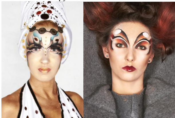
Фото конкурсных работ с прошлых Фестивалей «Хрустальный Ангел»

ВНИМАНИЕ! Все правила, указанные в Положении о Чемпионате «Fantasy Style» являются неотъемлемой частью условий конкурса фантазийный макияж!