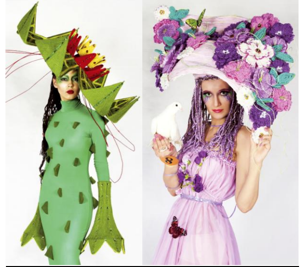
Фото конкурсных работ с прошлых Фестивалей «Хрустальный Ангел»

12. В конкурсе афроплетение и брейдинг модель, представляющая работу конкурсанта, должна будет продефилировать 2 раза на главной сцене Фестиваля, а именно, днем (мини-дефиле во время оценивания жюри) и в вечерней шоу-программе во время церемонии награждения конкурсантов.