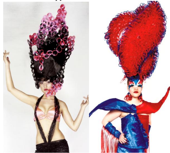
Фото конкурсных работ с прошлых Фестивалей «Хрустальный Ангел»:

ВНИМАНИЕ! Все правила, указанные в Положении о Чемпионате «Fantasy Style» являются неотъемлемой частью условий конкурса фантазийной прически!